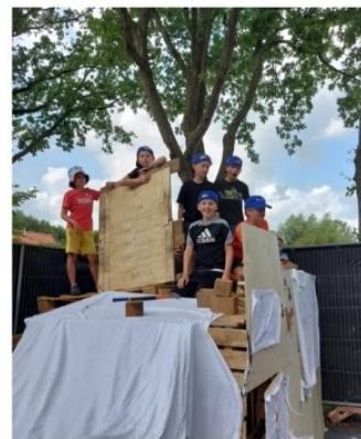
Op de eerste dag van de ZSW rijzen de bouwwerken meteen de hoogte in.

Los van deze activiteiten op het WK Hiem bij K.V. Wordt Kwiek hebben de kinderen ook nog gemidgetgolft bij de Koppenjan en gezwommen in Zwembad Jubbega. Als spetterende afsluiting stond de plaatselijke brandweer paraat om het speciaal aangerukte opblaaszwembad, dat onderdeel is van een buikschuifbaan, te vullen. Al met al een zeer geslaagde zomerspelweek! Superbedankt sponsors en vrijwilligers!!